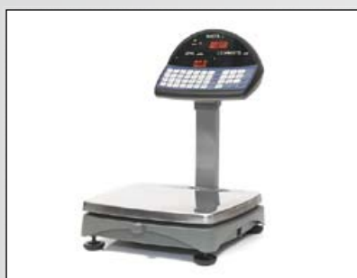
■ Для торговых весов