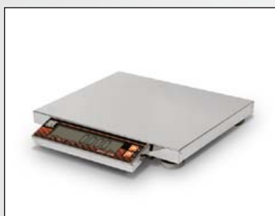
■ Для фасовочных весов