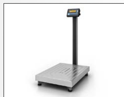
■ Для напольных весов